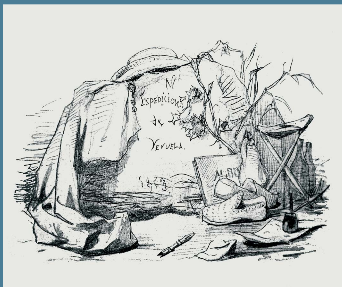
Grabado de Valeriano Bécquer